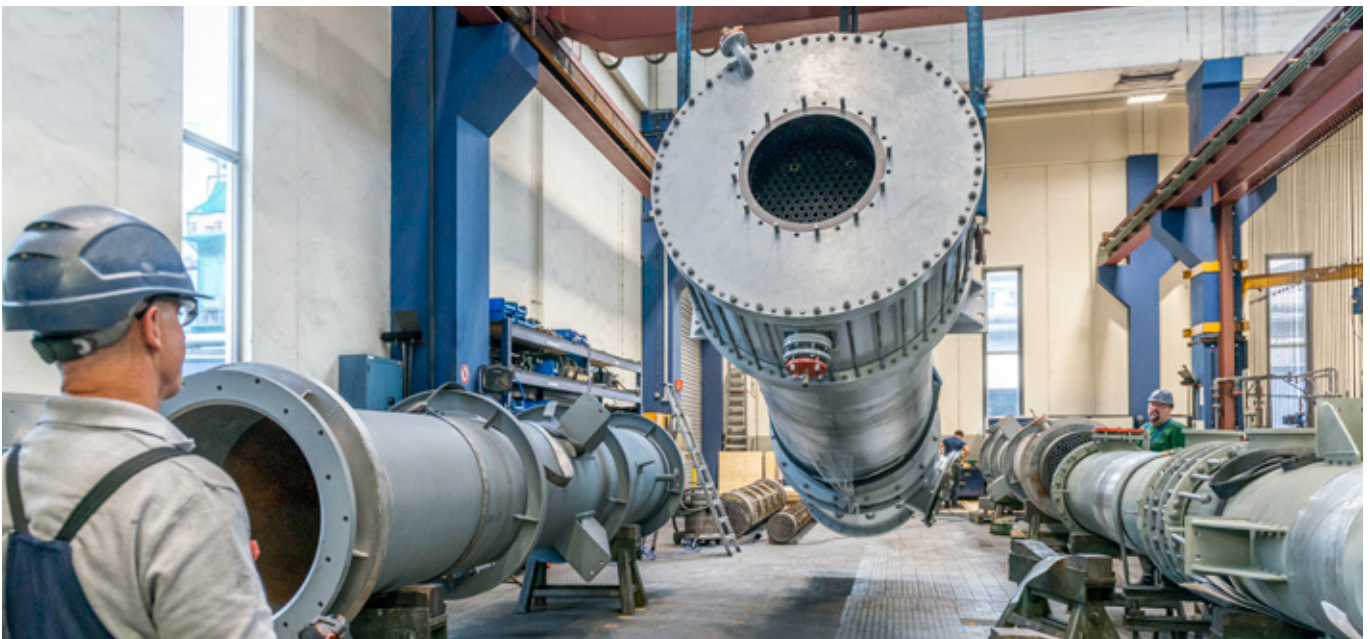
↑ Heben eines DIABON® Wärmeübertrager

Schadensmanagement und spezialisierte Monteurleistungen für Graphit-, PTFE- sowie SiC-Apparate und Systeme